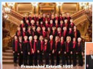
Frauenchor Erkrath 1997