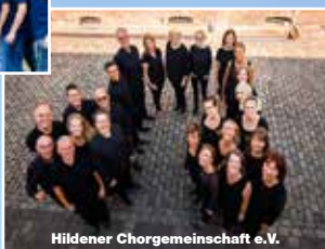
Hildener Chorgemeinschaft e.V.